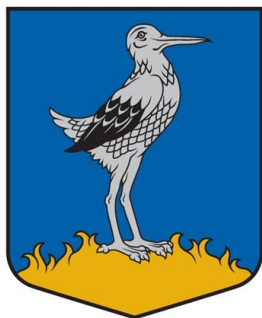
OŠUPES PAGASTA PĀRVALDE