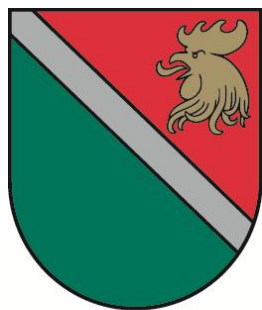
MADONAS NOVADA PAŠVALDĪBA